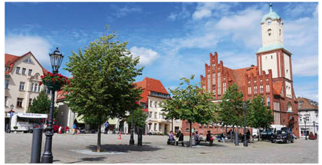
Markt Wittstock

Doch die Prignitz hat nicht nur landschaftliche Schätze zu bieten, sondern auch faszinierende Geschichten aus vergangenen Zeiten. Ein bemerkenswertes Beispiel ist die Geschichte der Industriellen-Familie Quandt, deren Ursprünge in der Region liegen. Die Familie, bekannt durch Persönlichkeiten wie Susanne Klat-