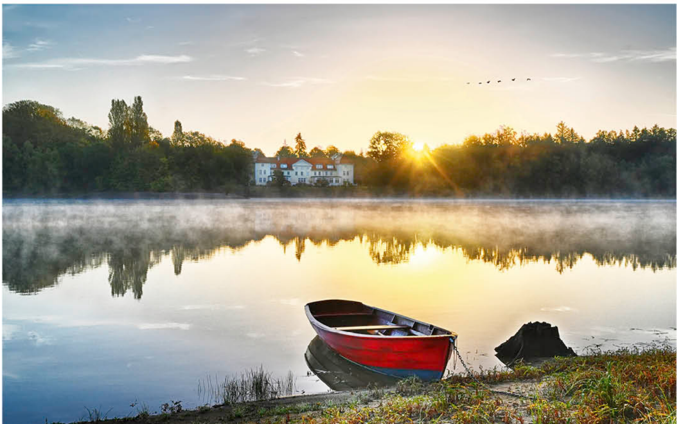
Wasser & mehr, Foto: Lutz

Die Prignitz ist somit nicht nur eine Region voller landschaftlicher Schönheit, sondern auch ein Ort mit einer reichen kulturellen und historischen Vergangenheit, die es zu entdecken gilt. Und was gibt es Schöneres, als diese Entdeckungsreise in einem nostalgischen Oldtimer entlang malerischer Alleen zu unternehmen?