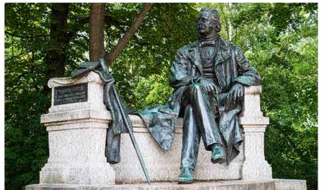
Fontane-Denkmal Neuruppin