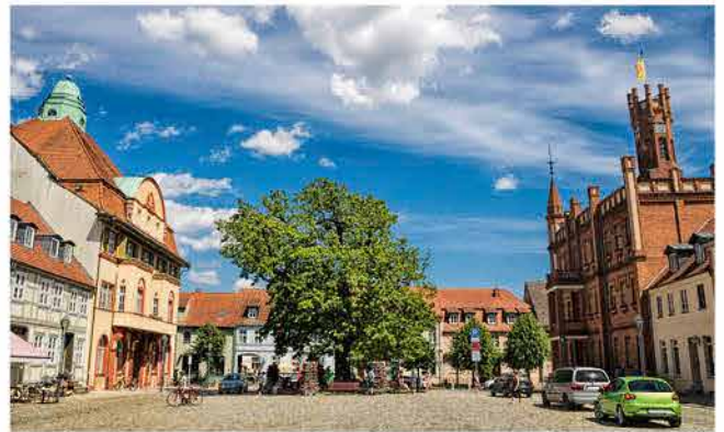
Marktplatz Kyritz mit Friedenseiche

Die Prignitzer Kulturlandschaft zeichnet sich nicht nur durch ihre kulturelle Vielfalt aus, sondern auch durch ihre einzigartigen Merkmale und Besonderheiten. Die Gegensätzlichkeiten der Region, verbunden mit ihrer Schönheit und Unberührtheit, machen sie zu einem besonderen Reiseziel. Durch ihre gute verkehrstechnische Anbindung an die umliegenden Ballungszentren wird die Prignitz als kulturelles Umland oder Erlebnisregion zunehmend attraktiv für Besucher aus Städten wie Berlin, Hamburg, Hannover, Braunschweig, Potsdam, Magdeburg, Schwerin und Rostock.