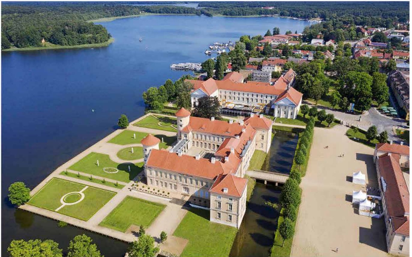
Schloss Rheinsberg und Grienericksee